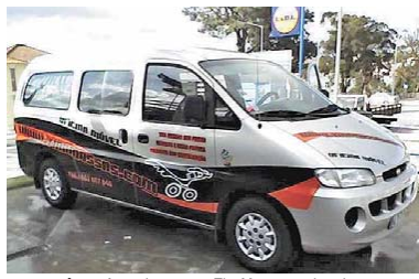
OFICINA MÓVEL – A van da empresa Tira Mossas, onde tudo começou