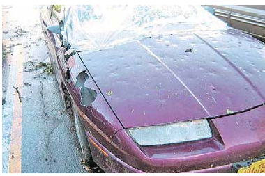
DO CÉU – Granizo amassa, martelinhos consertam, seguradora paga