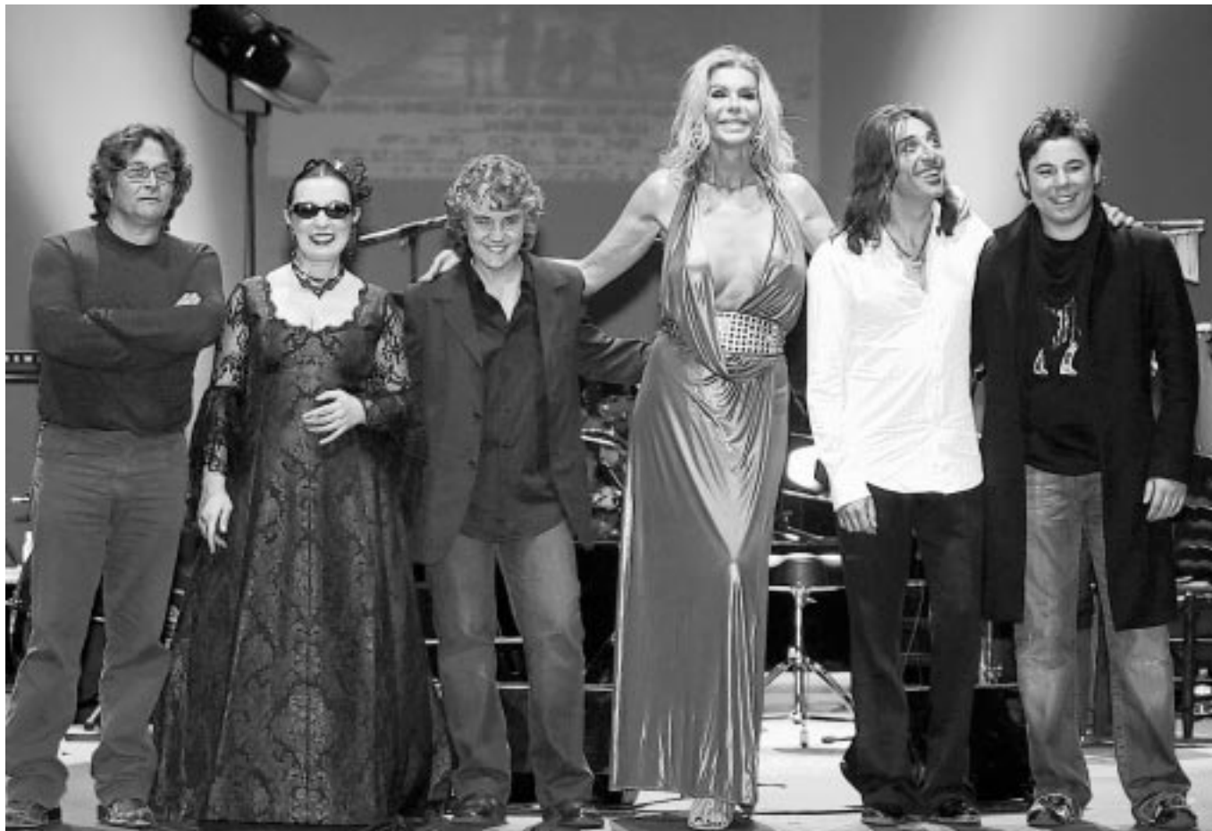
Chano Domínguez, Martirio, Mayte Martín, Bibiana Fernández, Antonio Carmona y Miguel Poveda, anoche en Sevilla

El superintendente y director artístico de La Scala de Milán, Stéphane Lissner, ha vuelto a programar la versión de Robert Carsen de «Cándido», de Leonard Bernstein, que el pasado 28 de diciembre decidió suspender por des-acuerdo en la producción, que muestra borrachos y en paños menores a Bush, Berlusconi, Blair, Chirac y Putin. La coproducción no se ajustaba al planteamiento inicial realizado por Carsen, según justificó Lissner.