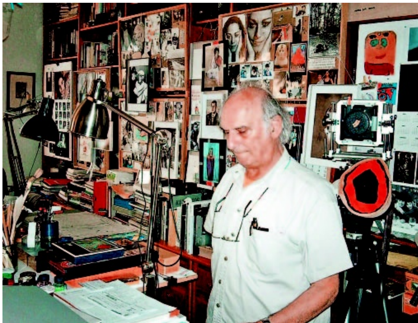
Carlos Saura, en su estudio

Carlos Saura se define como un gran amante de la música, y «el fado es un género que conozco muy bien, no era desconocido para mí». Ha estudiado y escuchado fados en los últimos meses como nadie, con el fin de transmitir en su película «las visiones» que tiene del fado, «la tristeza de la gente, una especie de llanto, las historias de romances, las conexiones con países como Brasil y antiguas colonias africanas de Portugal...» Su intención es, por tanto, avanzar en la visión que existe actualmente del fado, y espera que la respuesta sea la