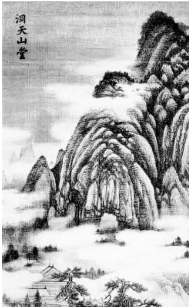
Una de las ilustraciones del libro, con caligrafía en la parte superior

En la China actual, dice Chen, «todavía hoy, políticos, intelectuales y empresarios usan, en sus discursos, versos clásicos»