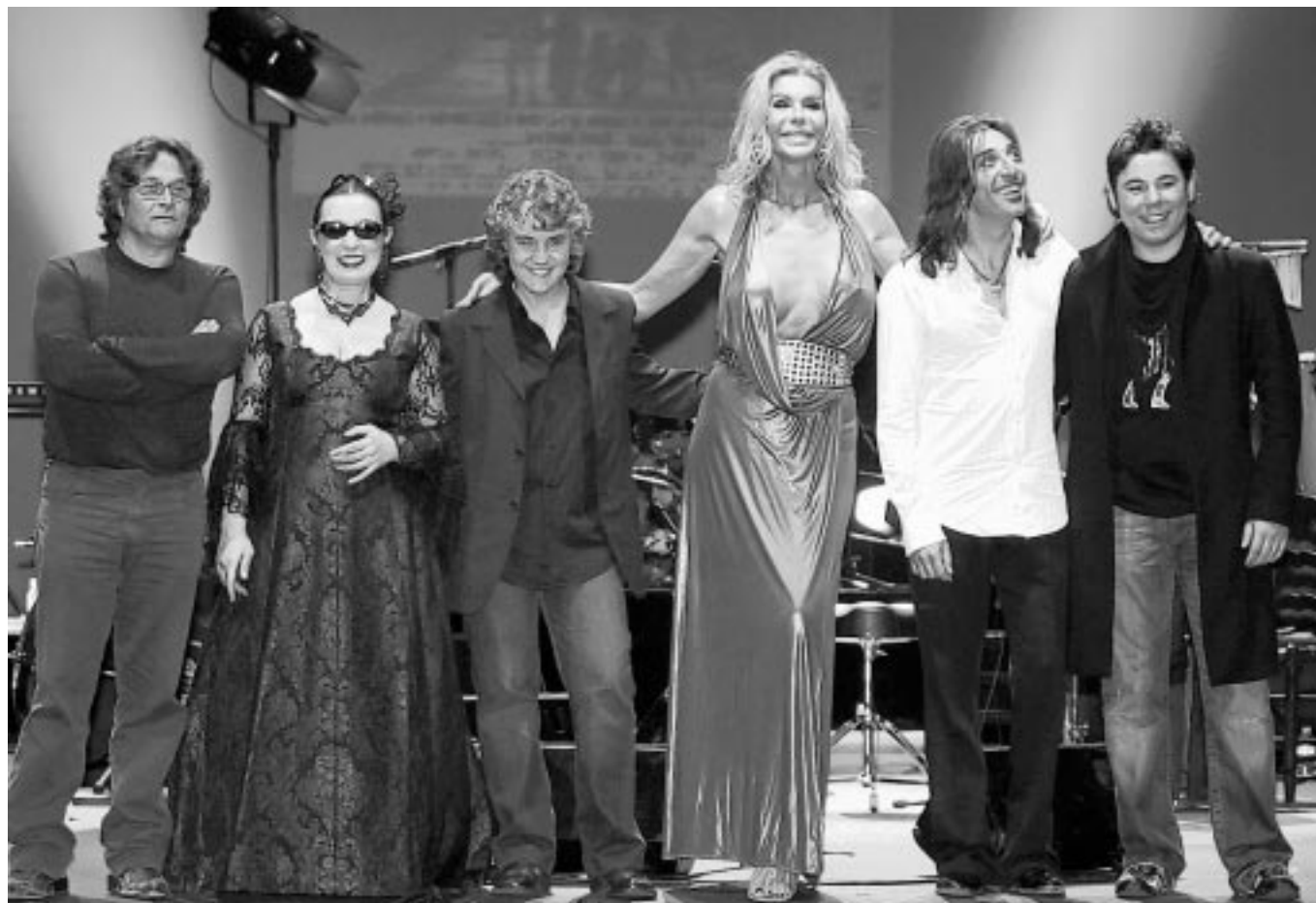
Chano Domínguez, Martirio, Mayte Martín, Bibiana Fernández, Antonio Carmona y Miguel Poveda, anoche en Sevilla

El superintendente y director artístico de La Scala de Milán, Stéphane Lissner, ha vuelto a programar la versión de Robert Carsen de «Cándido», de Leonard Bernstein, que el pasado 28 de diciembre decidió suspender por des-acuerdo en la producción, que muestra borrachos y en paños menores a Bush, Berlusconi, Blair, Chirac y Putin. La coproducción no se ajustaba al planteamiento inicial realizado por Carsen, según justificó Lissner.